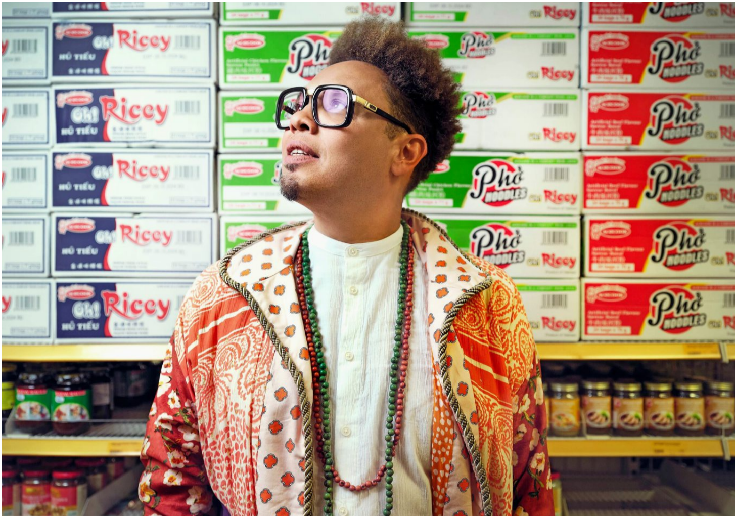
Marc Sway trifft in Andermatt auf das Swiss Orchestra.

Im Zentrum der diesjährigen Ausgabe stehen die grossen Themen Heimweh und Fernweh, Aufbruch und Nachhaus-